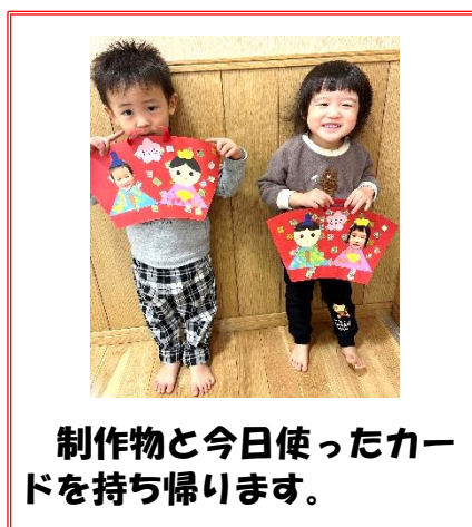
制作物と今日使ったカードを持ち帰ります。

最後に「みんなの可愛いお顔のカードも探そうか〜」と聞くと、「するー!」と元気な返事があったので、お友だち探しゲームも楽しみました。