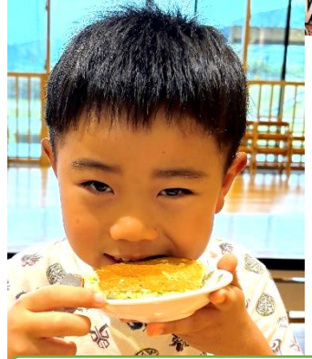
よもぎの味少しだけするよ