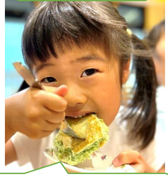
もちもちして美味しい！