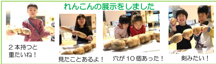
れんこんの展示をしました